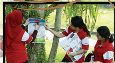
Poster kempen kebersihan.. Staf Pustaka Negeri Sarawak sedang menggantung poster kempen kebersihan di pokok-pokok di sekitar taman.