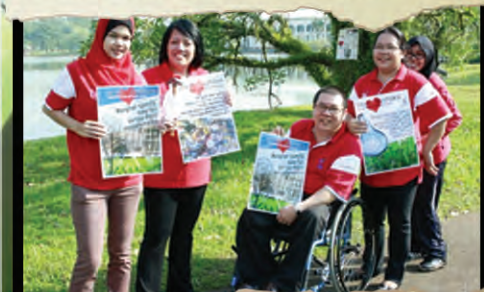
Kami Sayang Pustaka..Staf Pustaka Negeri Sarawak bersedia dan bersemangat untuk menggantung poster kempen kebersihan di pokok-pokok di sekitar taman Pustaka.