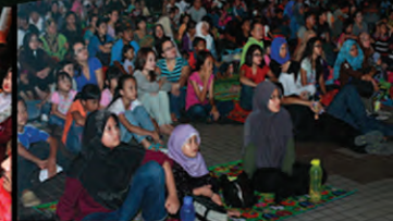
KHUSYUK...Para penonton khusyuk menghayati tayangan.