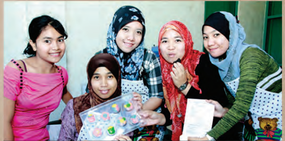
Menarik .. Antara coklat yang dihasilkan oleh peserta, menarik dan berwarna-warni

Bengkel ini diadakan bertujuan untuk memberi pengetahuan dan pendedahan kepada para peserta mengenai pembuatan coklat di rumah. Selain itu, para peserta dapat mempelajari teknik pembuatan coklat dengan mudah di rumah dengan menggunakan peralatan dan bahan yang mudah didapati. Diharap dengan adanya bengkel sebegini, para peserta dapat menghasilkan produk sendiri dengan menggunakan coklat dan menambah hasil pendapatan.