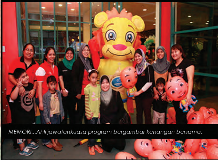
MEMORI...Ahli jawatankuasa program bergambar kenangan bersama.