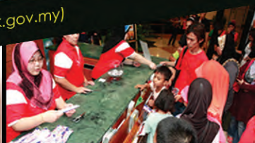
MERIAH...Sesi pendaftaran cabutan bertuah.

Filem "Geng Pengembaraan Bermula: Upin dan Ipin" telah menjadi pilihan untuk sesi tayangan pada kali ini. Dianggarkan seramai 600 penonton yang hadir pada malam tersebut. Sesi santai yang berlangsung selama hampir tiga jam ini dimeriahkan lagi dengan sesi cabutan bertuah. Sebanyak 20 buah hadiah bertuah telah disediakan untuk penonton bertuah pada malam tersebut. Program ini diadakan sebanyak dua kali setahun dan ianya merupakan acara tahunan Pustaka Negeri Sarawak.