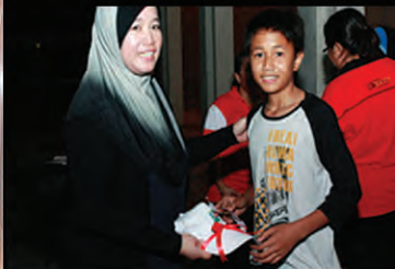
TUAH...Antara pemenang hadiah cabutan bertuah.