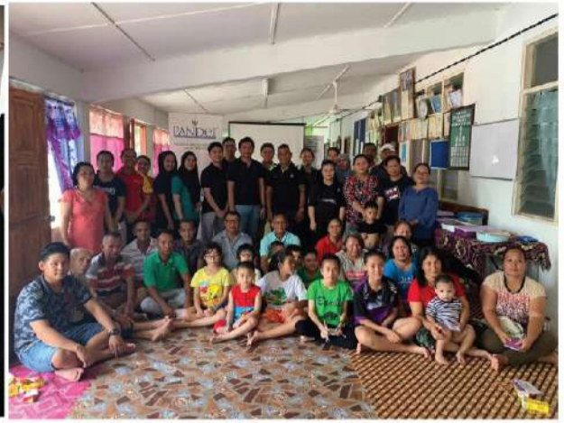
Rumah Panjai Petri Ambit (Sarikei) | 14 Februari 2020