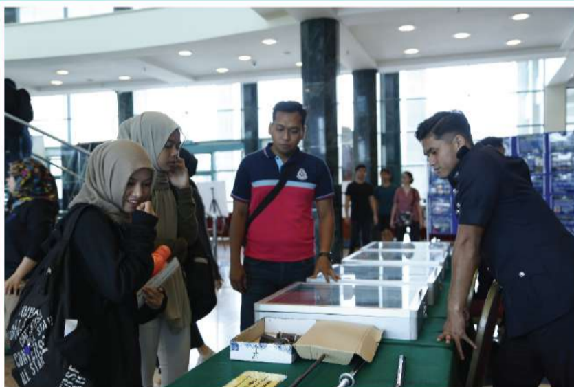
Pengunjung turut di pameran dengan pameran-pameran bahan yang menarik