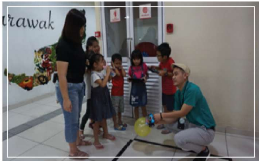
Gambar 5 : Aktiviti STEM bersama pengunjung