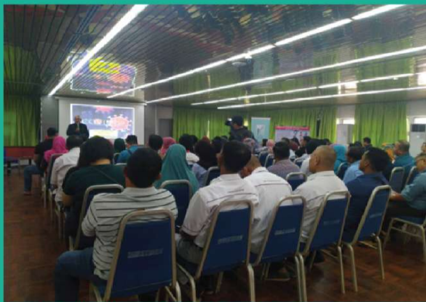
Gambar 1 : Peserta yang menghadiri ceramah komuniti

Ceramah yang telah diadakan pada 28 Februari 2020 ini bertajuk Coronavirus Covid-19 berikutan ancaman wabak tersebut yang merebak baru-baru ini. Ceramah ini diadakan bertujuan untuk memberi maklumat dan informasi serta isu-isu semasa yang berkaitan kepada masyarakat; berkongsi maklumat penting tentang bahaya Coronavirus (Covid-19) serta langkah-langkah pencegahan dan pemulihan. Seramai 114 peserta telah menyertai ceramah komuniti ini dan mereka juga telah mendaftar sebagai ahli baru Pustaka Negeri Sarawak, Sibü. Disamping itu, pameran berkaitan Covid-19 juga turut diadakan.