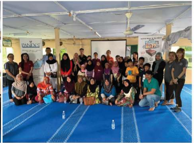
Surau Drahman (Sarikei) | 15 Februari 2020