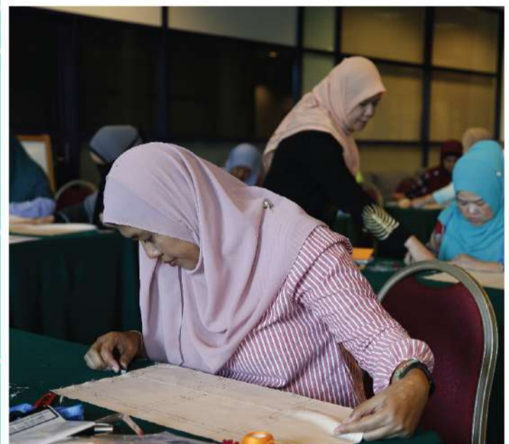
Antara peserta bengkel jahitan yang gigih mempelajari beberapa teknik-teknik menjahit