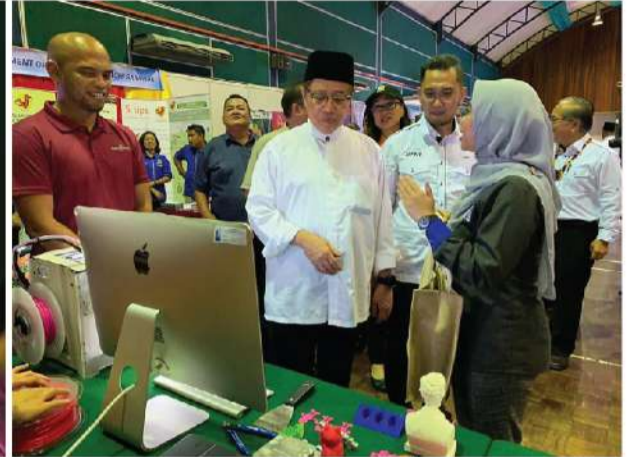
Dewan Mesra, Simunjan (Samarahan) | 10 - 12 Januari 2020