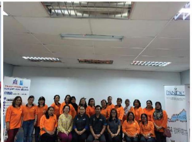
Dewan Masyarakat Serian | 12 Mac 2020