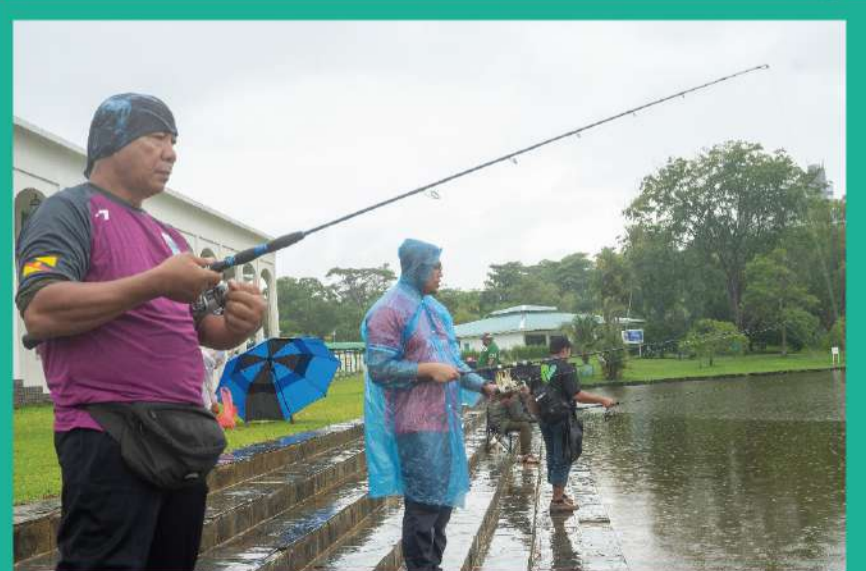
Acara pertandingan memancing