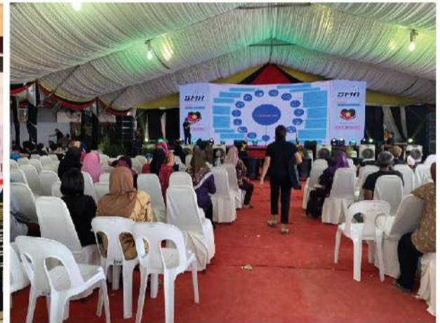
Dewan Mesra, Pusa (Betong) | 7 - 9 Februari 2020