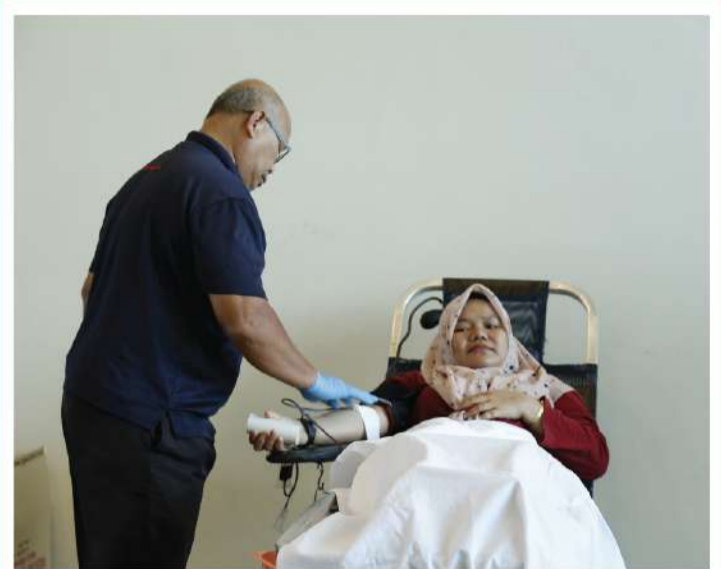
Antara pelanggan yang bermurah hati menderma darah dalam Program Menderma Darah pada hari tersebut