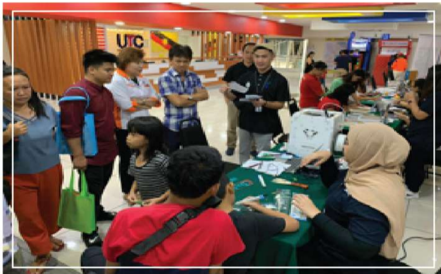
Gambar 4 : Pegawai menerangkan mengenai perkhidmatan makerspace