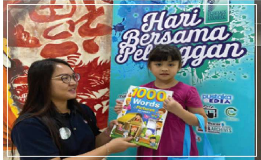
Gambar 3 : Pembentangan buku oleh pengunjung cilik