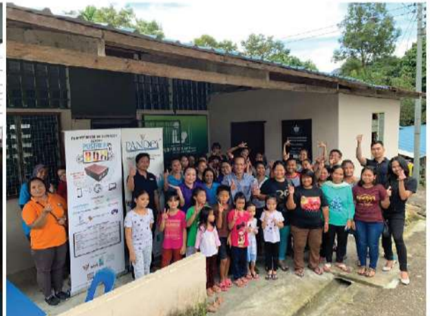
Perpustakaan Desa Kampung Giam Lama, Padawan (Kuching) | 7 Mac 2020