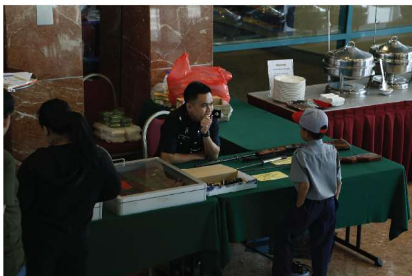
Antara pengunjung cilik yang tidak melepaskan peluang untuk mengemukakan beberapa soalan untuk pengetahuan mereka