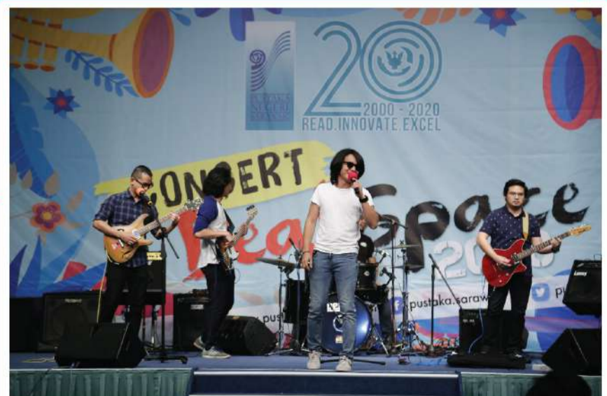
Persembahan mini konsert dari kumpulan Sonar Instict