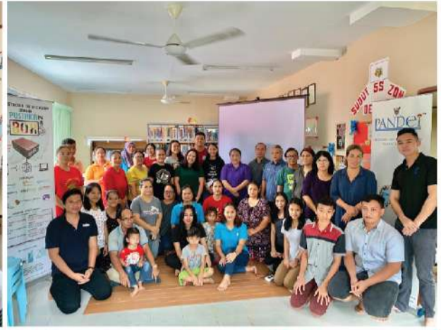
Perpustakaan Desa Kampung Semerdang, Padawan (Kuching) | 7 Mac 2020