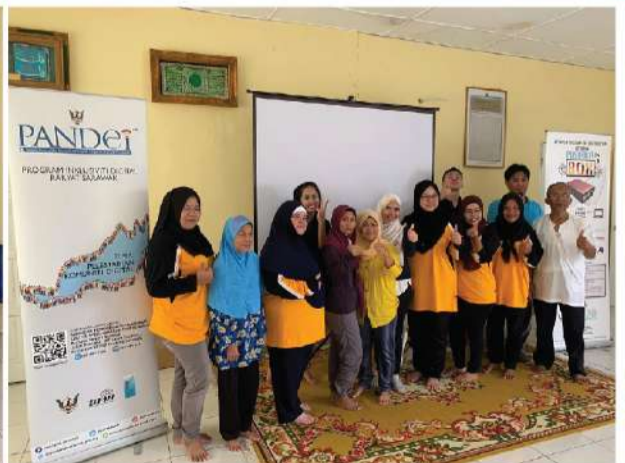
Kampung Sungai Midin (Kuching) | 22 Februari 2020