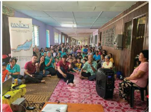
Rumah Panjai Nyaggau (Sarikei) | 16 Februari 2020