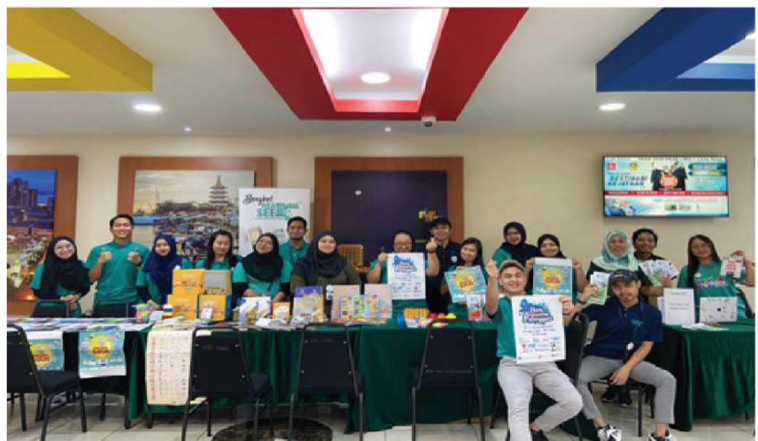
Gambar 1 : Pegawai dan kakitangan yang bertugas sempena Hari Bersama Pelanggan Pustaka Negeri Sarawak Sibu

Pelbagai aktiviti menarik dan perkhidmatan diadakan sepanjang dua (2) hari program diadakan iaitu; Promosi Keahlian Baharu, Promosi Fasilitas, Aktiviti STEM, Book Selection, Promosi Perkhidmatan Unit Sarawakiana, Kuiz, Book Club, Reading Seeds, dan banyak lagi.