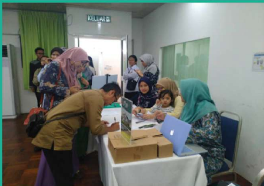
Gambar 3 : Peserta mendaftar sebagai ahli baru Pustaka Negeri Sarawak, Sibü