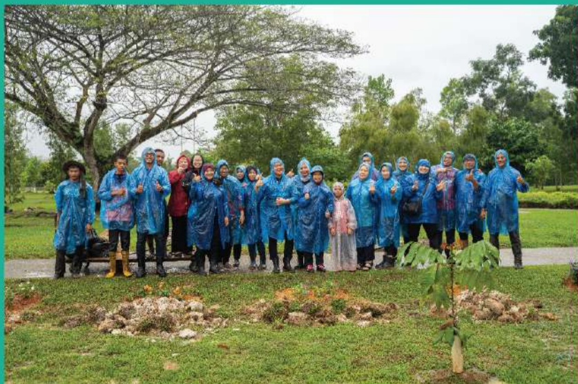
Program penanaman pokok diteruskan dalam keadaan hujan