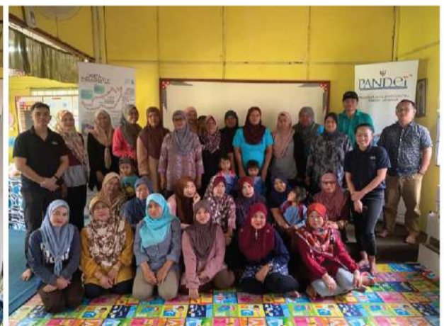
Perpustakaan Desa Pusa (Betong) | 10 Februari 2020