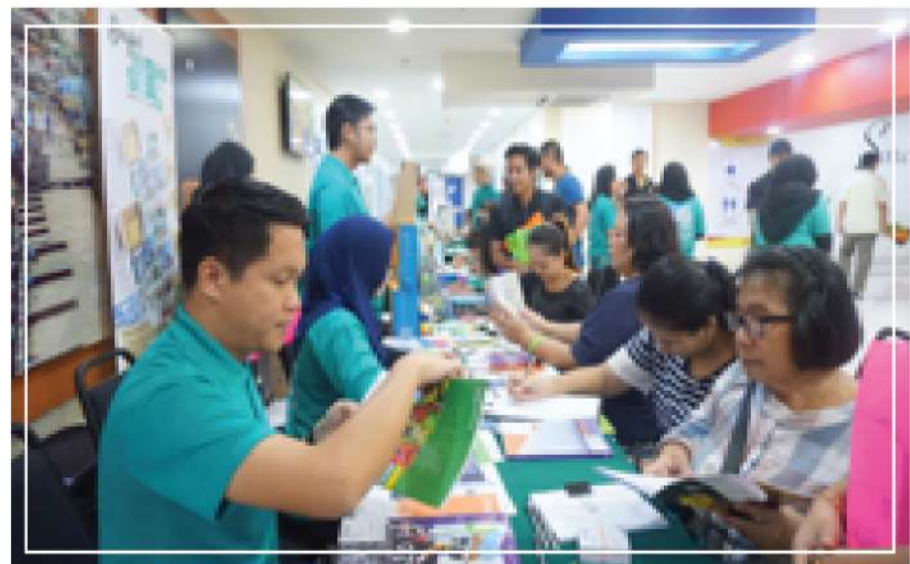
Gambar 7 : Pengunjung yang datang pada dua (2) hari program diadakan