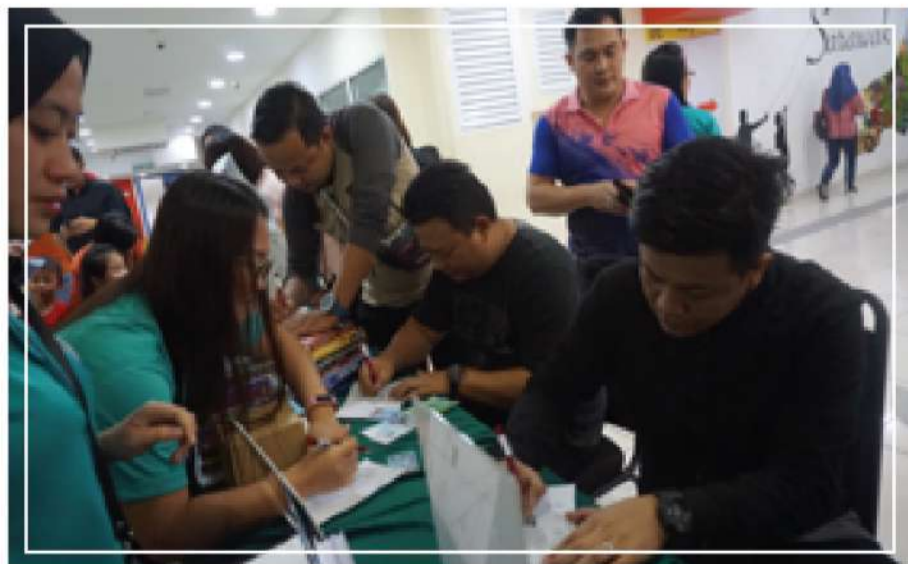
Gambar 6 : Pendaftaran Keahlian Baharu