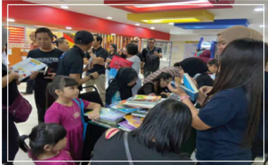
Gambar 2 : Pegawai memberi keterangan berkenaan program Book Club

Hari Bersama Pelanggan Pustaka Negeri Sarawak Sibul ini julung kali diadakan di Sibul bertujuan mempromosikan perkhidmatan yang bakal disediakan kepada masyarakat Sibul apabila memulakan operasi setelah bangunan siap dan sempurna pada pertengahan tahun ini. Antara perkhidmatan yang bakal ditawarkan di Pustaka Sibul kelak adalah; Peminjaman buku dengan pelbagai koleksi menarik, ruang belajar yang selesa, serta perkhidmatan sewaan fasiliti bagi tujuan ilmiah.