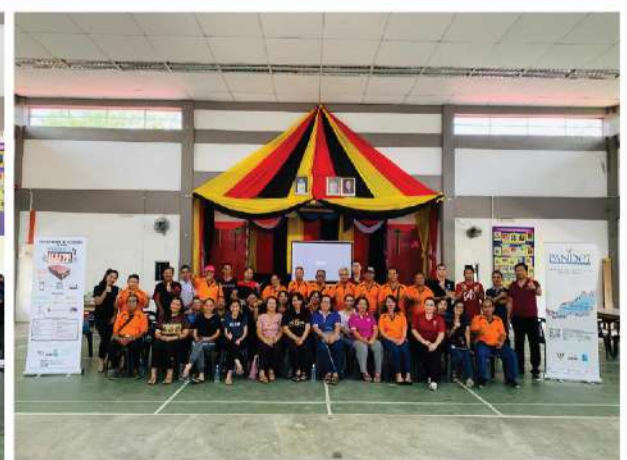
Dewan Johnical Rayong, Skim Skrang (Sri Aman) | 11 Februari 2020