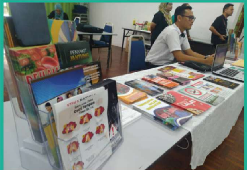
Gambar 4 : Brosur dan pameran berkenaan Covid-19 juga turut disediakan.