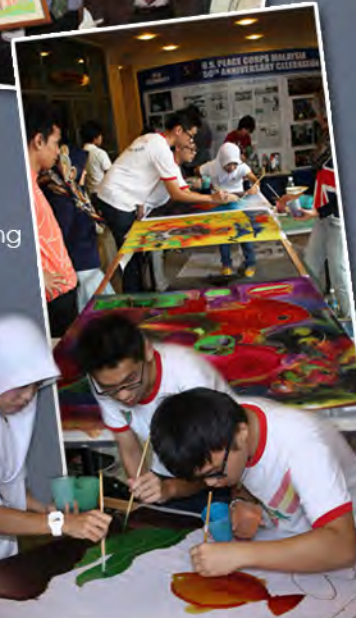
HANDS-ON...Students were taught the basics of batik painting techniques.