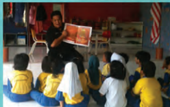
SCIENCE, MATHEMATICS AND TECHNOLOGY WEEK AT PUSTAKA MIRI