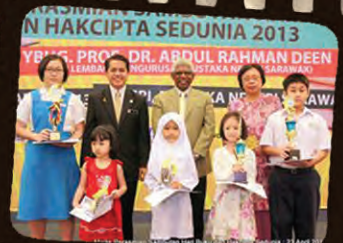
TAHNIAH... Antara penerima anugerah "Pembaca Aktif Pustaka" yang menerima hadiah dan sijil penghargaan dari Pustaka Negeri Sarawak.