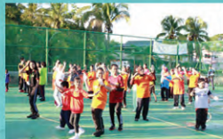
PROGRAM LAN BERAMBEB DI KAMPUNG MELAYU TEBAKANG