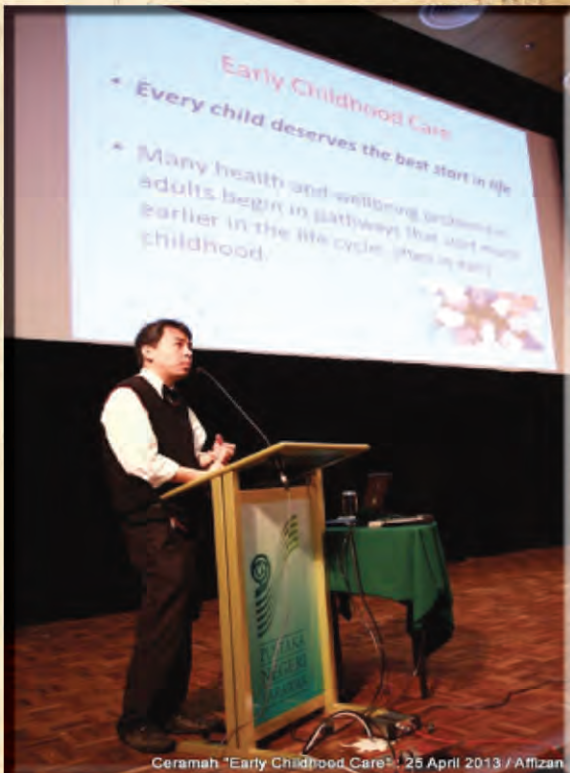
Ceramah "Early Childhood Care" : 25 April 2013 / Aftizan

KHUSYUK... Peserta yang hadir khusyuk mendengar maklumat mengenai penjagaan awal kanak-kanak.