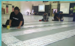
COMMEMORATING MIRI MAY FEST 2013 WITH A RECORD FOR THE LONGEST PHILATELY LINE IN MALAYSIA