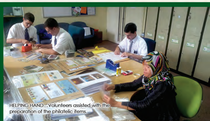
HELPING HAND...Volunteers assisted with the preparation of the philatelic items.