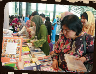
MERIAH... Tapak pameran dan jualan buku mendapat sambutan menggalakkan daripada orang ramai.