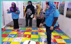
SAMBUTAN MENGGALAKKAN DI TAPAK PAMERAN PUSTAKA SEMPERNA HARI HARTA INTELEK NEGARA 2013