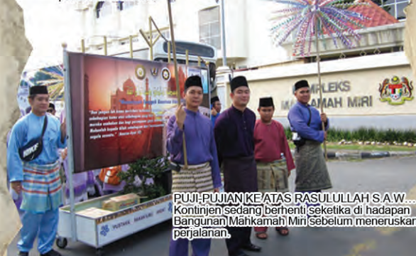
PUJI-PUJIAN KE ATAS RASULULLAH S.A.W... Kontinjen sedang berhenti seketika di hadapan Bangunan Mahkamah Miri sebelum meneruskan perjalanan.