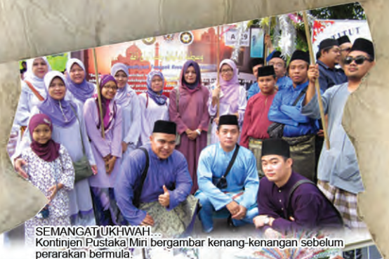
SEMANGAT UKHWAH... Kontinjen Pustaka Miri bergambar kenang-kenangan sebelum perarakan bermula.

Perhimpunan telah berlangsung di perkarangan Dewan Suarah Miri sebelum perarakan bermula. Perarakan tahun ini telah melalui beberapa jalan utama Bandaraya Miri sebelum berakhir di tapak permulaan.