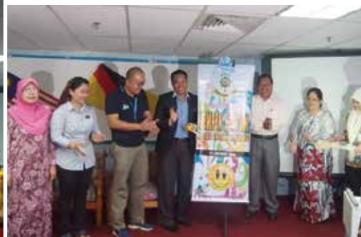
■ Program Early Child Ready To Read di Perpustakaan Awam Limbang