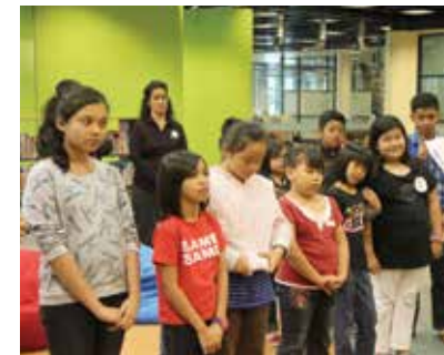
■ Spelling Bee & Pantas Congak