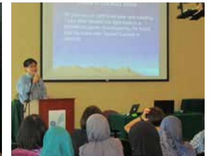
■ Ceramah Kesihatan : Scoliosis