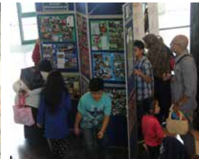
■ Pameran Get To Know Pustaka Negeri Sarawak, Miri