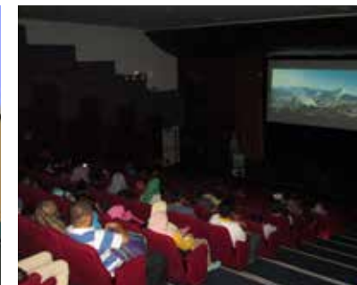
■ Movie Marathon