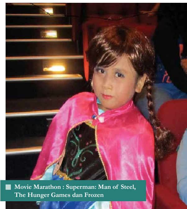
Movie Marathon : Superman: Man of Steel, The Hunger Games dan Frozen