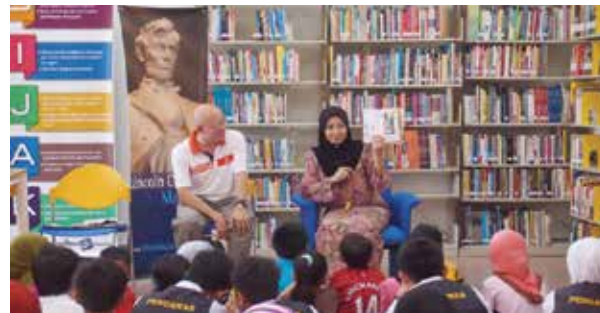
■ Program Bacaan Kegemaran Saya di Perpustakaan Desa RPR Lawas

Unit Perkhidmatan Komuniti Pustaka Negeri Sarawak telah menganjurkan Program Jangkauan Ilmu ke Utara (Limbang & Lawas). Antara program-program yang diadakan ialah Early Child Ready To Read, Bacaan Kegemaran Saya dan juga aktiviti kraftangan untuk para penduduk pada 21-23 Oktober 2014. Program ini telah diadakan di beberapa tempat seperti di Perpustakaan Awam Limbang, Perpustakaan Desa Batu Biah, Meritam Limbang, Perpustakaan Desa RPR Lawas dan Kampung Punang Lawas. Program ini telah disertai oleh 434 orang pelajar, kanak-kanak, penduduk luar bandar dan kakitangan kerajaan.