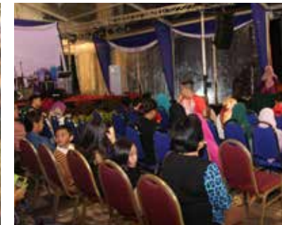
■ Ceramah Neurotherapy