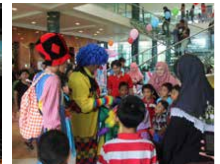
■ Sepetang Bersama Uncle Clown