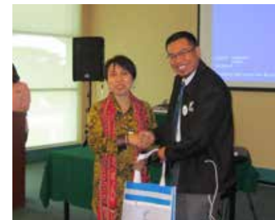
■ Bicara Usahawan