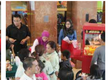
■ Jualan Makanan & Produk