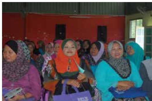
■ Program Early Child Ready To Read dan Bacaan Kegemaran Saya di Kampung Punang Lawas