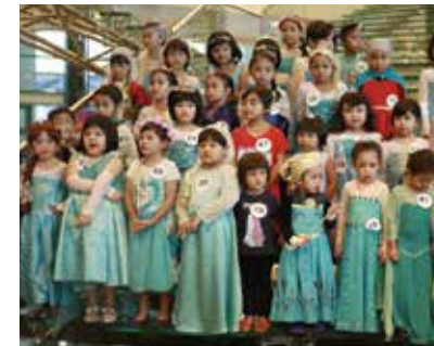
■ Pertandingan Tiru Gaya Frozen