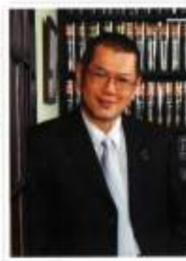
Encik Sunny Si Peguambela & Peguamcara Pesuruhjaya Sumpah Tetuan Si dan Rakan-Rakan Si & Associates Advocates & Solicitors Commissioner for Oath