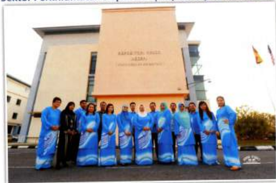
Barisan Hadapan, Dari Kiri / First Row, From Left :